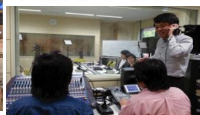
SCB放送局キャンパススタジオ