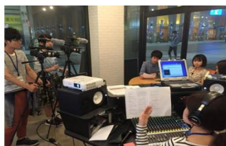
1F: SCB放送局新市街スタジオから放送中