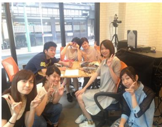
1F: SCB放送局新市街スタジオから放送中