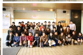
SCB放送局キャンパススタジオ